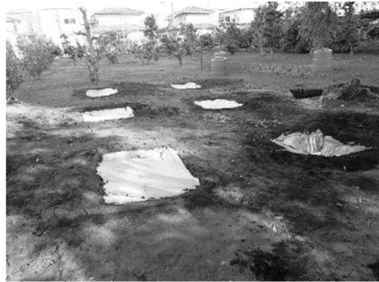
図-1. 神奈川県藤沢市日本大学生物資源科学部苗圃場での試験の様子

試験区は薬剤処理区3区と無処理区3区の合計6試験区を神奈川試験地と群馬試験地のそれぞれに設置した。各試験区の大きさは1m×1mとし、深さ45cmの穴を掘った。