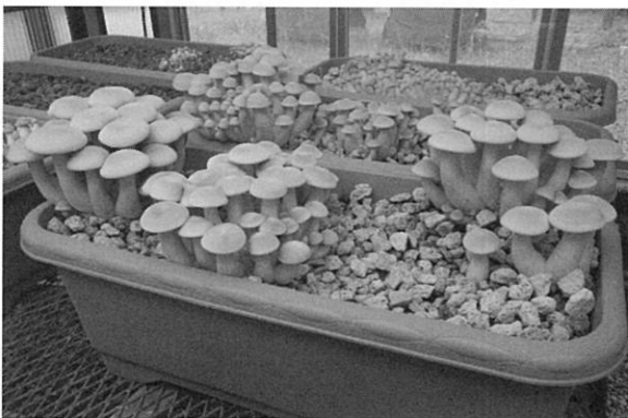
図-2. 軽石砂区の発生状況 (2012. 8. 14)